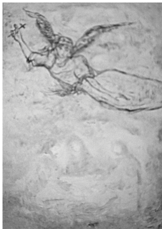
Nada Žiljak Večera u Emausu , akrilik na platnu/infrared, snimak u V i IRZ spektru, 100 x 70 cm