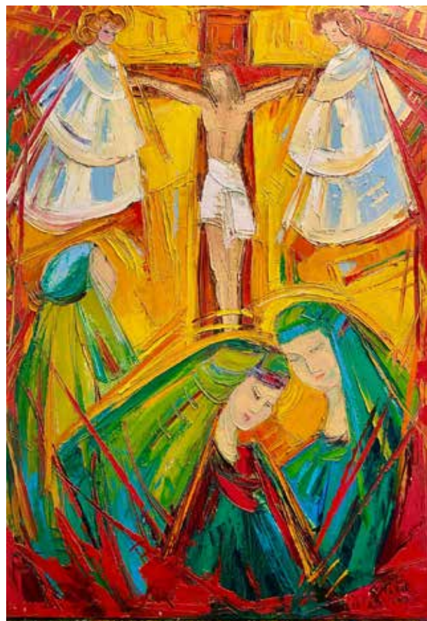
Marija Puzak Pod križem , ulje na platnu, 100 x 70 cm