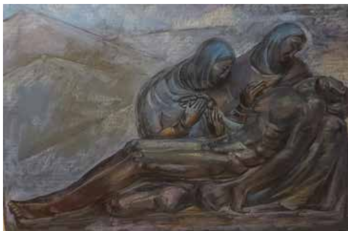
Zvezdana Mihalke Oplakivanje (po Meštroviću) , suhi pastel, 80 x 60 cm

Pieta MMXXV , kombinirana tehnika na platnu, 101 x 151 cm