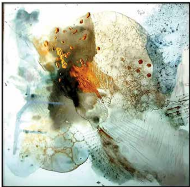
Andreja Hojnik Fišić

Uskrsnuće , kombinirana tehnika na platnu, 70 x 70 cm