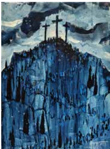
Ana Marija Botteri Golgota , akrilik na platnu, 40 x 30 cm